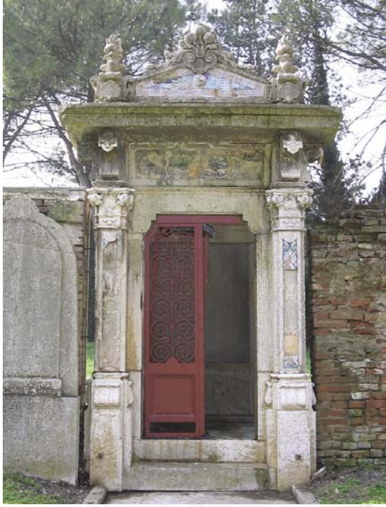
fig . 1 .