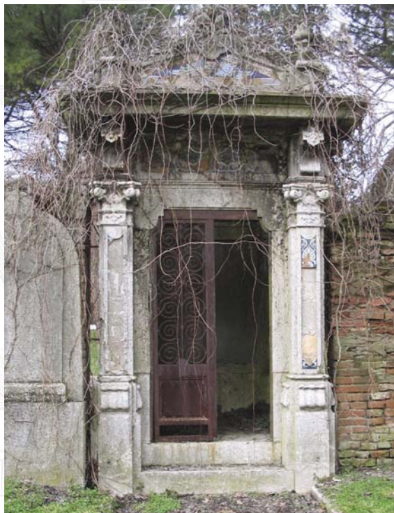
Stato di conservazione della tomba.

Pulitura con spazzola e acqua per asportazione degli infestanti trattati con biocida.