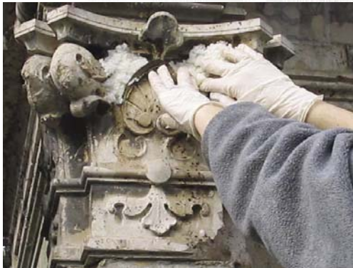
Applicazione di carta giapponese.

Intervento di pulitura del materiale lapideo con impacco di polpa di carta e carbonato d'ammonio.