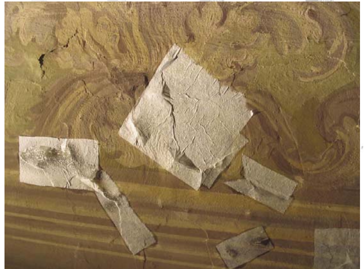
Dettagli dei dipinti su cui è stata applicata la velinatura con carta giapponese per fissare la pellicola pittorica e l'intonachino distaccato.