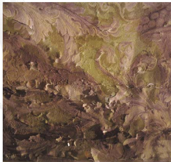
Immagine del precario stato di conservazione del soffitto dipinto.