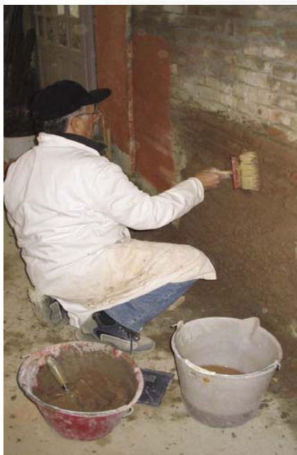
fig . 1 .