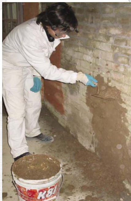
Bagnatura del muro e stesura dell'intonaco.