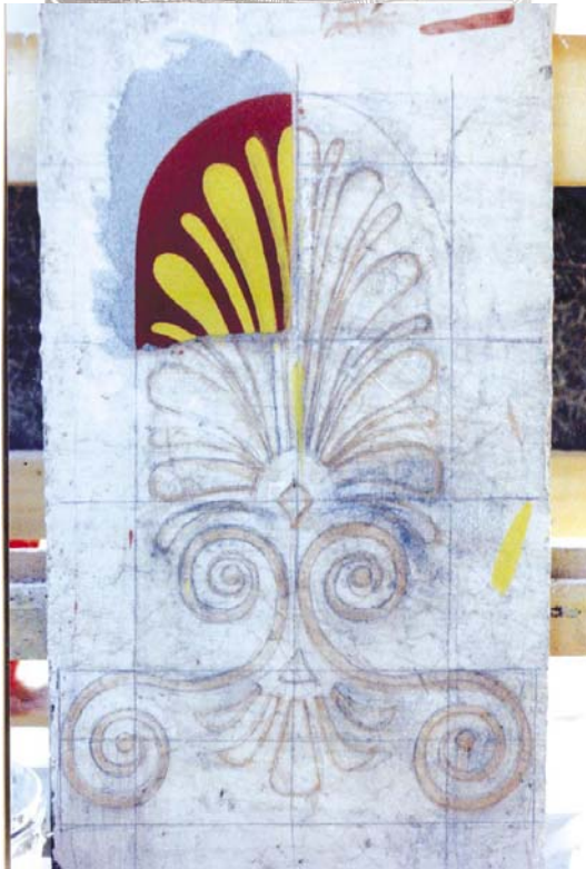
Studio del chiaroscuro e del finto rilievo con tecnica a tempera.