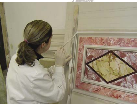
Boiseries con cornici decorative e inserti marmorei realizzati con tecniche miste.