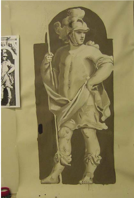
Studio di figura: tecnica monocromatica a tempera su tela.