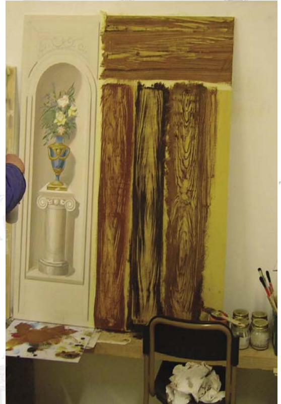
Finto legno realizzato con diverse tecniche, utilizzando strumenti creati in laboratorio utili anche per riprodurre la finta radica. Tecnica: olio e tempera.